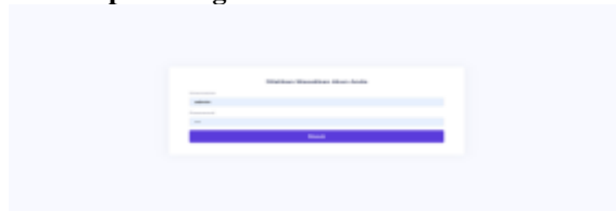
Gambar 4. Tampilan Login