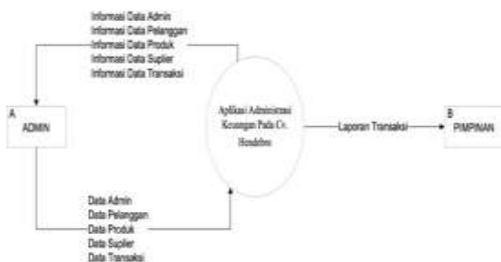
Gambar 1. Diagram konteks

Diagram konteks di atas menunjukkan hubungan antara sistem dengan admin dan pimpinan dimana admin dapat mengelola semua data master seperti produk, suplier dan transaksi.