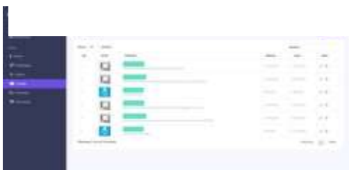
Gambar 9. Tampilan Produk