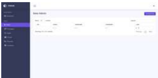
Gambar 6. Tampilan Admin