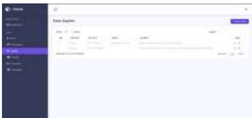
Gambar 8. Tampilan Pelangga