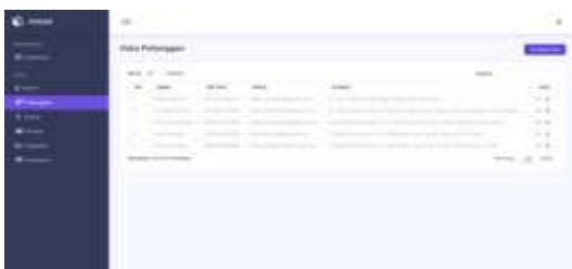
Gambar 7. Tampilan Pelangga