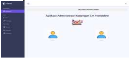
Gambar 5. Tampilan Dashboard