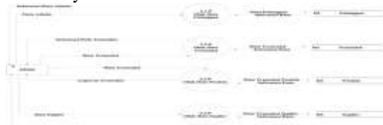
Gambar 3. Diagram level 1 proses 2

Diagram level 1 proses 2 dijabarkan dengan representasi tingkat atas dari sistem yang menggambarkan proses utama dan aliran data antara sistem dan entitas eksternal dengan merinci proses internalnya