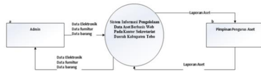
Gambar 1. Diagram Konteks

Diagram konteks merupakan diagram yang menggambarkan hubungan input dan output antar sistem dan dunia luar (kesatuan luar), pemrosesan yang terjadi pada diagram konteks mewakili proses dari seluruh sistem. Diagram konteks dibawah ini akan menggambarkan bentuk aliran data dari dalam Sistem Informasi pengolahan data Aset di Kantor Sekretariat Tebo.