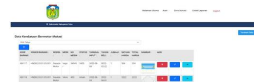
Gambar 6. Mutasi Kendaraan Bermotor

Tampilan Halaman Mutasi Kendaraan Bermotor merupakan menu untuk melihat halaman mutasi kendaraan bermotor pada Sistem Informasi Pengelolaan Data Aset Pada Kantor Sekretariat Daerah Kabupaten Tebo Dapat dilihat pada gambar dibawah ini :