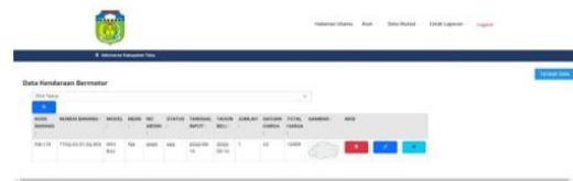
Gambar 5. Data Kendaraan Bermotor

Tampilan Halaman Data Kendaraan Bermotor untuk melihat data kendaraan bermotor Pada Sistem Informasi Pengelolaan Data Aset Pada Kantor Sekretariat Daerah Kabupaten Tebo Dapat dilihat pada Gambar dibawah ini :