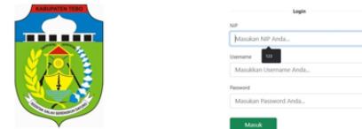
Gambar 2. Tampilan Form Login Admin

Halaman Login Admin digunakan Admin untuk masuk ke halaman Utama Sistem Informasi Pengelolaan Data Aset Pada Kantor Sekretariat Daerah Kabupaten Tebo Admin dapat masuk kehalaman melalui halaman ini. Adapun Halaman Tampilan Form Login dapat dilihat pada gambar dibawah ini :