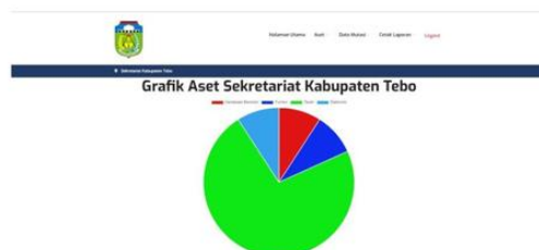
Gambar 3. Halaman Utama

Tampilan Halaman utama yang digunakan bagi pegawai untuk dapat mengelola data pada Sistem Informasi Pengelolaan Data Aset Pada Kantor Sekretariat Daerah Kabupaten Tebo Tampilan halaman utama dapat dilihat pada Gambar dibawah ini :