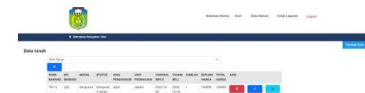
Gambar 7. Data Tanah dan Bangunan

Tampilan Halaman Data tanah dan bangunan merupakan menu untuk menambahkan data tanah dan bangunan pada Sistem Informasi Pengelolaan Data Aset Pada Kantor Sekretariat Daerah Kabupaten Tebo Dapat dilihat pada gambar dibawah ini :