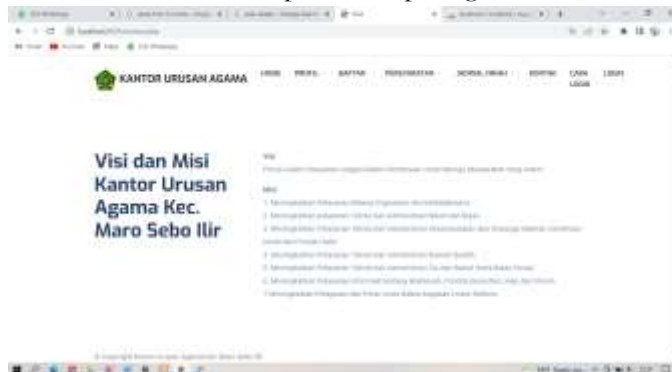
Gambar 5. Tampilan Halaman Visi dan Misi

Halaman Visi dan Misi Website Kantor Kua Maro Sebo Ilir digunakan Catin Adapun Halaman Visi dan Misi Kantor Kua Maro Sebo Ilir dapat dilihat pada gambar 5