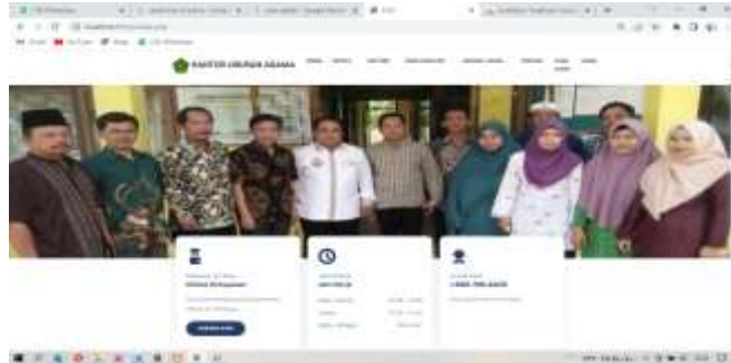
Gambar 2. Tampilan Halaman Utama Website Kantor Kua Maro Sebo Ilir

Halaman Utama Website Kantor Kua Maro Sebo Ilir digunakan pelanggan untuk melakukan proses Login, melihat persyaratan, dan Pendaftaran pada Sistem Informasi Kantor Kua Maro Sebo Ilir, Adapun Halaman Utama Website Kantor Kua Maro Sebo Ilir dapat dilihat pada gambar 2