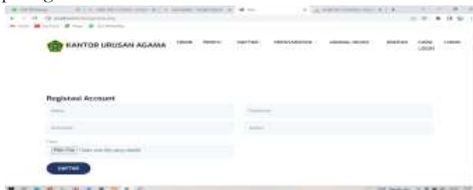
Gambar 3. Tampilan Form Registrasi

Form Registrasi Catin Digunakan Catin Untuk Mendaftarkan Data Diri Pada Website Kantor Kua Maro Sebo Ilir, Adapun Halaman Tampilan Form Daftar Catin dapat dilihat pada gambar 3.