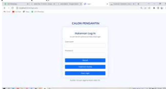
Gambar 4. Tampilan Halaman Utama

Halaman Login calon pengantin merupakan kan halaman calon pengantin untuk masuk kehalaman Web Kantor Kua Maro Sebo Ilir Adapun Halaman Tampilan Form Halaman Login Calon pengantin dapat dilihat pada gambar 4.