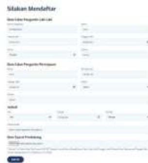
Gambar 6 Tampilan Halaman Tambah Catin

Tampilan Halaman Tambah Catin digunakan calon pengantin untuk melihat menambahkan data diri pada Sistem Informasi Kantor Kua Maro Sebo Ilir, Adapun Tampilan Halaman Tambah catin dapat dilihat pada gambar 6